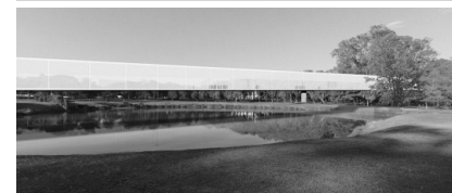
spbr arquitetos, progetto per il nuovo MAM – Museu de Arte Moderna de São Paulo (2013), courtesy lo studio

Lavora sulle parole chiave: prova a descrivere il progetto usando 3 parole. Che effetto potrebbe farti percorrere uno spazio come questo? In che modo lo spazio circostante viene percepito da dentro il museo? In che modo le opere esposte all'interno del Museo diventano parte anche loro dell'ambiente esterno?