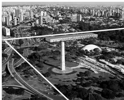
spbr arquitetos, progetto per il nuovo MAM – Museu de Arte Moderna de São Paulo (2013)

Il progetto per il nuovo MAM, nel Parco di Ibirapuera, ha le seguenti caratteristiche: un quadrato con quattro lati identici, ciascuno lungo 750x10x10 metri. I quattro lati formano un percorso lungo 3 km, ogni area è di 7.500 m 2 , e l'area totale di 30.000 m 2 tra aree piene e vuote. Il pavimento è trasparente, le facciate calibrano la luce in base a ciò che si desidera esporre all'interno o all'esterno dell'edificio.