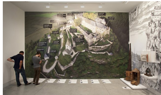
Door, Biennale Architettura 2014, Elements of Architecture