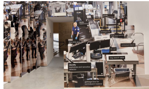
Door, Biennale Architettura 2014, Elements of Architecture

Nel 2010 Koolhaas ha ricevuto il Leone d'Oro alla carriera alla Biennale Architettura. In quell'occasione presentò un progetto sul concetto di conservazione, che sottolineava come "circa il 12% del pianeta ricade sotto i diversi regimi di conservazione naturale e culturale – territorio che continua ad aumentare. Inoltre, l'età di ciò che viene preservato continua a ridursi. Alla fine del XIX secolo solo i monumenti antichi ricevevano protezione legale; oggi gli edifici di 30 anni vengono regolarmente elencati come siti storici.