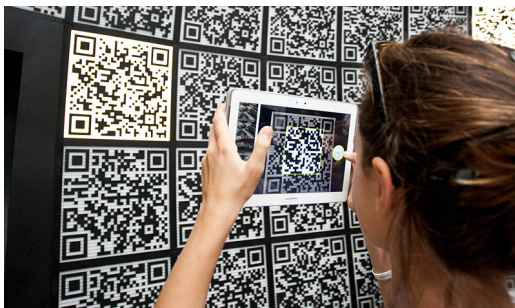
Padiglione Russia, i-city , Biennale Architettura 2012

Secondo il curatore, "il processo di visita del Padiglione imita un processo di apprendimento in cui il quadro del mondo non è immediatamente visibile e si apre lentamente". Sei d'accordo? In che senso il curatore ha utilizzato la tecnologia come una texture? Prova a fare qualche riflessione.