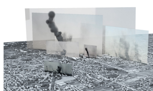
Forensic Architecture, modello 3D, battaglia del "Black Friday", courtesy lo studio

Nella foto puoi osservare un modello 3D creato da Forensic Architecture ottenuto incorporando fotografie e video raccolti principalmente da social network e fonti online. Questa immagine si propone di ricostruire un momento dei bombardamenti avvenuti durante la guerra di Gaza del 2014, presso Rafah.