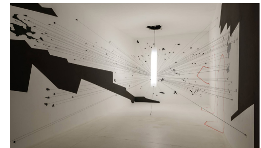
Forensic Architecture, Biennale Architettura 2018

Osserva l'immagine: si tratta della ricostruzione di una stanza, appartenente ad un edificio in Pakistan, presso Miranshah, su cui è stato lanciato un drone. Il modello indaga in che modo i detriti del missile hanno colpito e si sono distribuiti attorno alle pareti provando a ricostruire quanto è accaduto. Parte di quei detriti non sono stati trovati: a tuo avviso questo che cosa dimostra, o che cosa vorrebbe dimostrare? (Osserva le sagome rosse tracciate sulla parete... a cosa si riferiscono?)