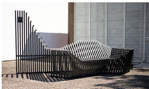
Atelier Marko Brajovic, NSDC, Padiglione Brasile, Muros de Ar, Biennale Architettura 2018

Alla Biennale Architettura 2018 il Padiglione Brasile ha affrontato il tema delle barriere all'interno delle città, alla ricerca di modi diversi di pensarle, nel tentativo di trasformarle da elementi di separazione in elementi di incontro.