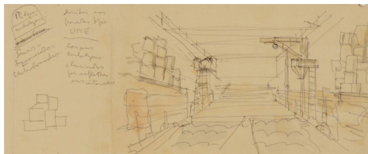
Prospettiva della scena, Na Selva das Cidades (1969)

Il titolo dell'opera richiama un lavoro dell'architetta Lina Bo Bardi che nel 1969 realizzò le coreografie e i costumi per l'opera Na Selva das Cidades (Nella giungla delle città) di Bertold Brecht. Gli spettatori erano immersi in uno spazio decorato con dei graffiti urbani ad indicare il degrado delle periferie; come testimoni di un'azione che si svolgeva all'interno di un ring, la vita diventava metafora di un incontro di boxe.